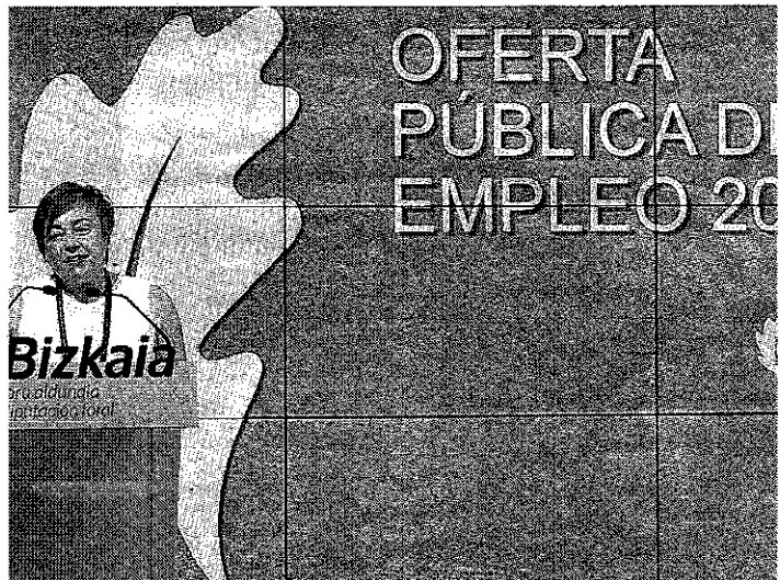
La diputada de Acción Social, Isabel Sánchez Robles.

El grueso de las plazas que saldrán a oferta, 112, será para auxiliar sanitario (de las cuales 38 se reservan para el turno de promoción interna). Además se ofertarán veintiún plazas de enfermero/DUE. Un total de diecisiete plazas serán para personal administrativo, de las que siete se reservan para el turno de pro-